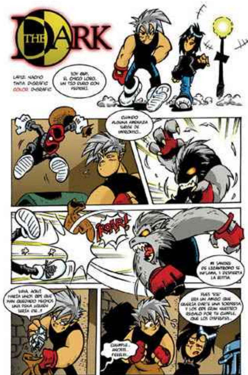
The Dark ▲ ¿El futuro de Dark Breed es The Dark?